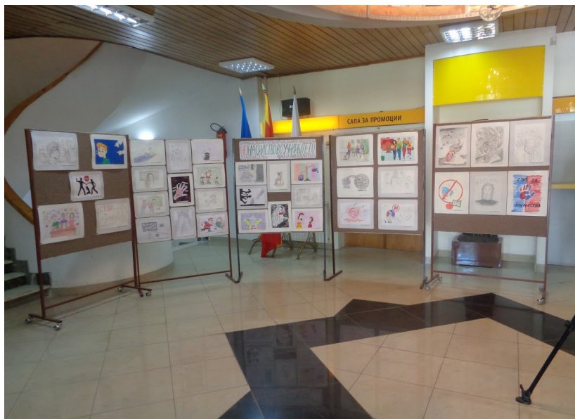
Од промоцијата на проектот

Дваесеттиот век беше обележан со настани на најголемо присуство на насилството и сторијата на човекот. Повеќе од половина од луѓето што го изгубија животот во вооружените судири во целиот свет, беа цивилни лица.