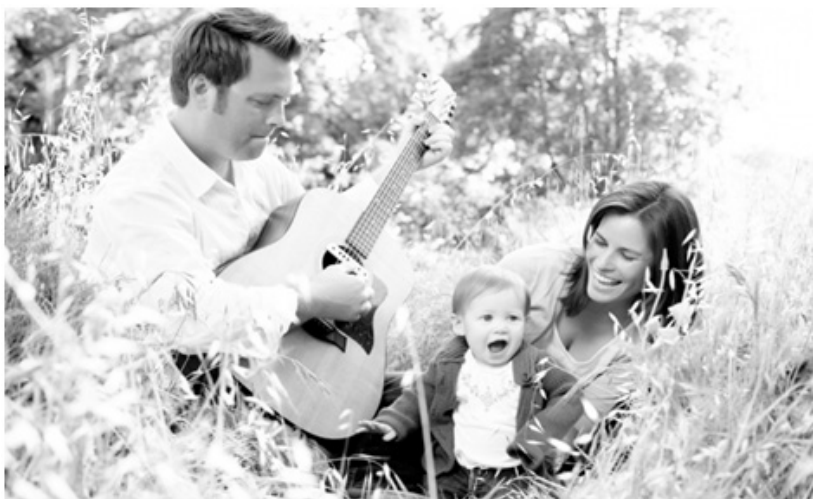
Слика 4: Секое дете го заслужува најдоброто

Доколку детето манифестира насилно однесување, треба да се откријат причините зошто дошло до тоа, а потоа на детето и на семејството да им се даде соодветна психо-социјална поддршка како процес на психичко и социјално зајакнување за успешно справување со проблемите и градење на психички здрав и достоин начин на живот во семејството и социјалната средина.