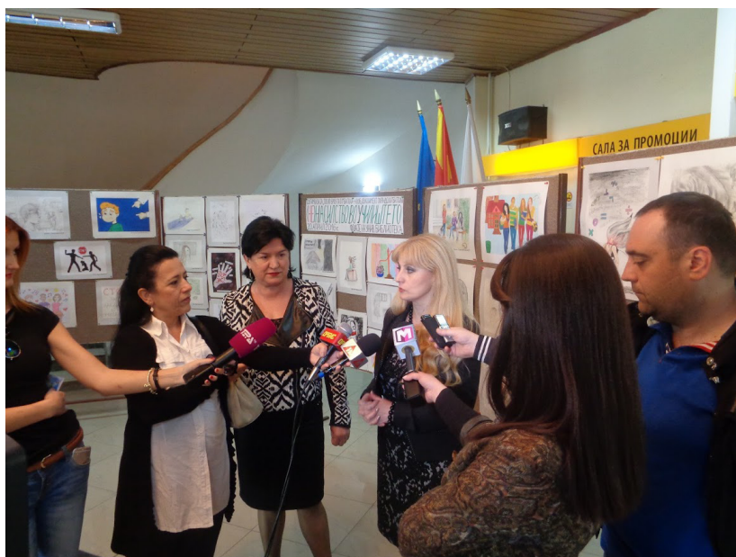
Од промоција на проектот