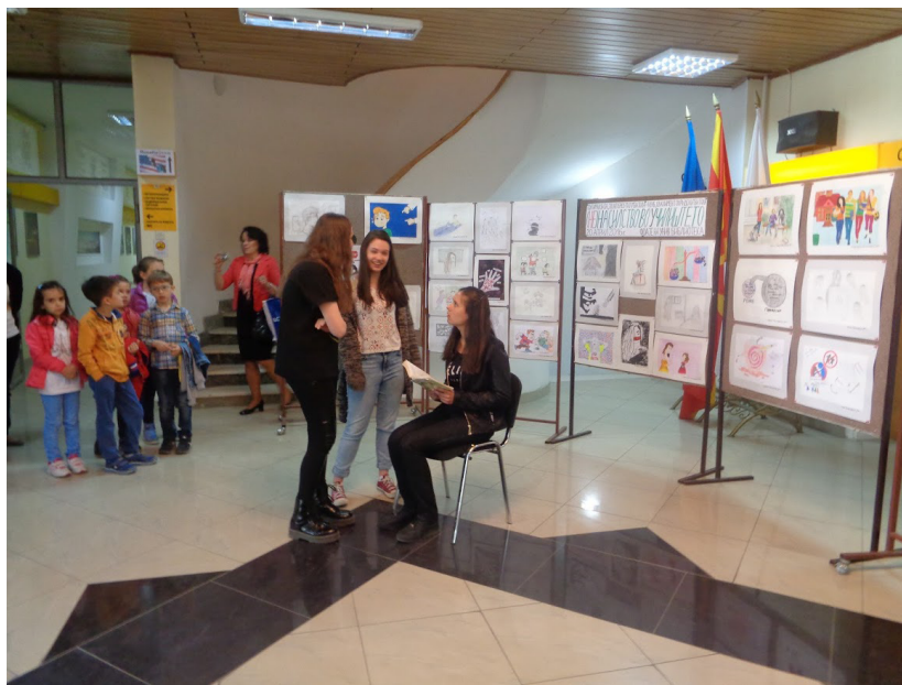
Од промоцијата на проектот