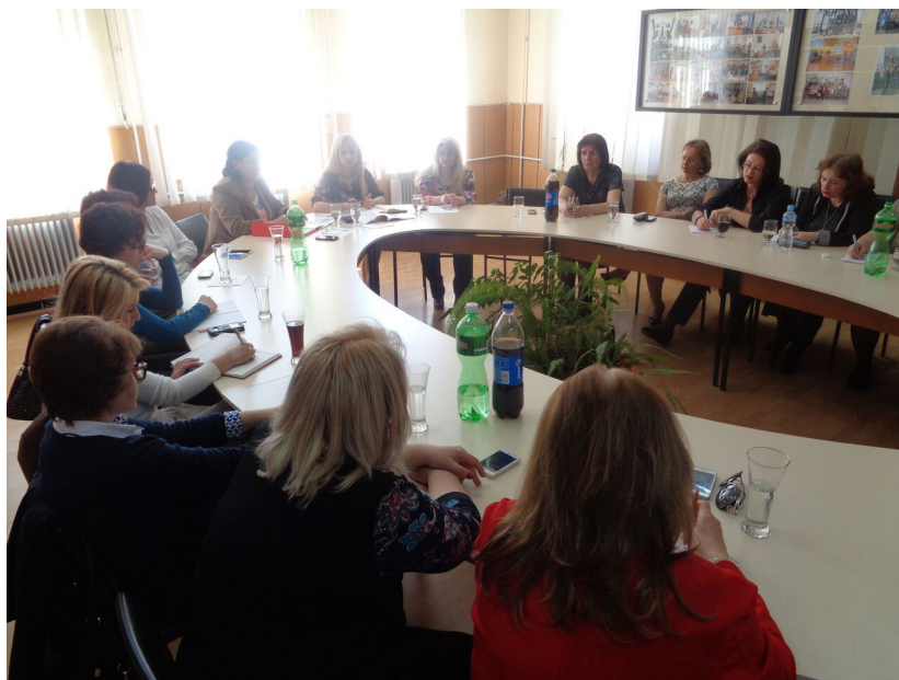
Од работните средби