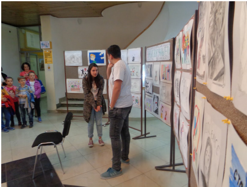
Од промоцијата на проектот

Шкарик О. Ненасилна трансформација на конфликти, Филозофски факултет, Скопје, 2006