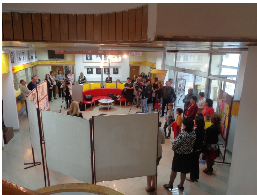
Од промоцијата на проектот