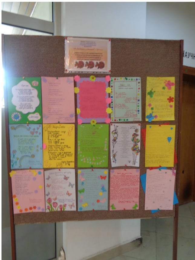
Од промоцијата на проектот