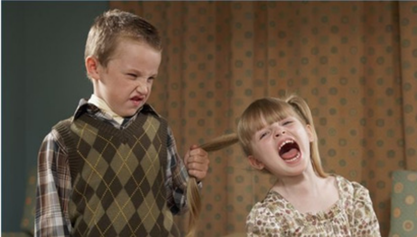
Слика 2: Врсничко насилство

Периодот на основно образование, исто така, е многу важен во психо-физичкиот и афективно-социјалниот развој на детето. Овој период опфаќа времетраење од девет години и е поделен во три воспитно-образовни подпериоди. Првиот подпериод ги опфаќа прво одделение, второ одделение и трето одделение. Овој период е многу важен за адаптација на детето и за негово описменување, но не помалку важен за неговото позитивно воспитување. Вториот подпериод ги опфаќа четврто одделение, петто одделение и шесто одделение. Во овој период настанува преминот на детето од одделенска настава во предметна настава и се зголемува важноста кај детето од врсничката поддршка, комуникација и социјализација. Додека третиот подпериод ги опфаќа седмо одделение, осмо одделение и деветто одделение. Во текот на овој период започнуваат пубертетските промени, детето чувствува зголемена потреба за тоа да не биде третирано како „дете“, уште повеќе се зголемува потребата од прифаќањето на врсниците, а исто така се