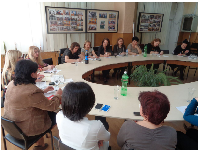
Од работните средби

Целта на тие активности е кај учениците уште од најмала возраст да се изградат позитивни вредности, да се подобрат вештините за почитување на другите, разрешување конфликти, справување со насилничко однесување, меѓусебно поддржување и соработка, не потпаѓање на врсничките притисоци, преземање одговорност за постапките, перципирање позитивни модели на идентификација.