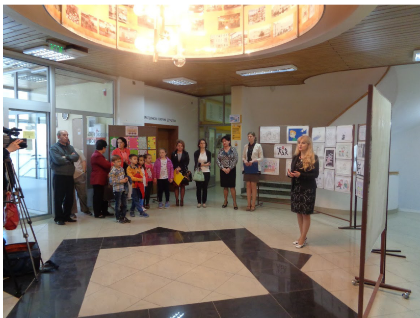
Од промоцијата на проектот