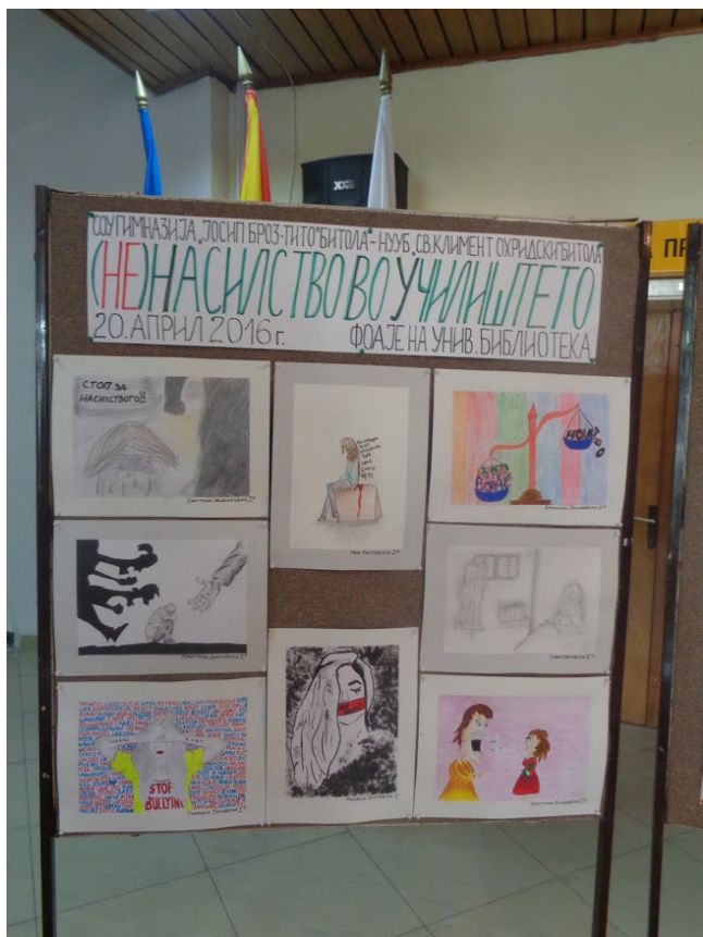
Од промоцијата на проектот

потенцијални точки за подобрување со кои ненасилната комуникација во училиштето ќе стане секојдневна практика и заштитен знак по кој ќе се препознава секое училиште.