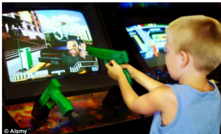
Слика 3: Насилство со видео игри

зголемува влијанието на „улицата“ во воспитувањето и социјализацијата. Развојот на техниката и електронската технологија се едни од најмоќните фактори во воспитувањето на децата во современото општество. Употребата на мобилните телефони, употребата на компјутерите и другите технички средства и помагала доведоа и до новиот вид на насилство-сајбер насилството. Затоа во превенцијата од насилното однесување на децата во овој период е многу важна превенцијата од сајбер насилството.