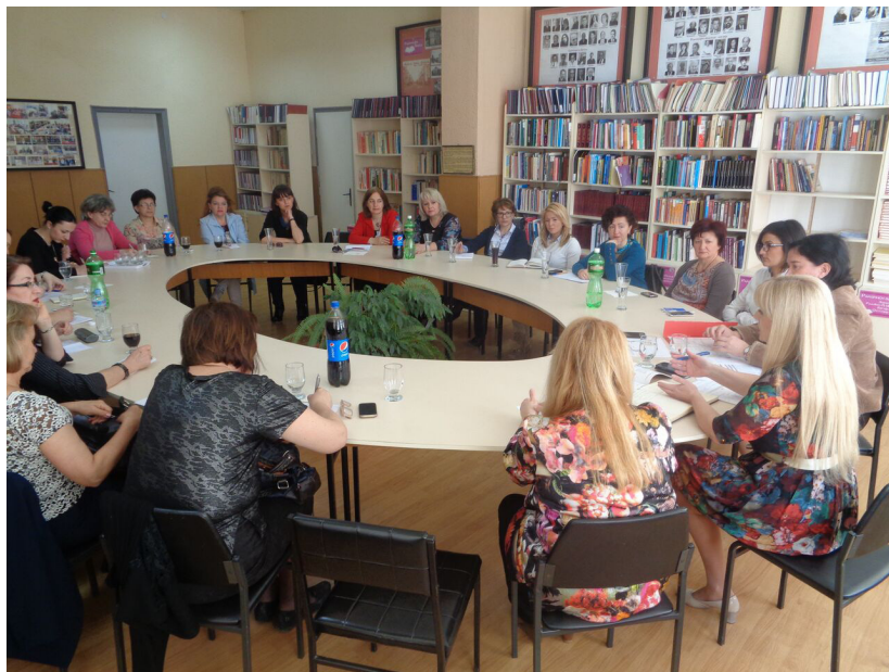
Од работните средби

проблемот. Кај учениците библиотерапијата комбинирана со други слични методи (арт терапија, музикотерапија...) се покажала одлична и како помош при исмејување, задевање, стравови, сексуални промени, внатрешни и надворешни конфликти.