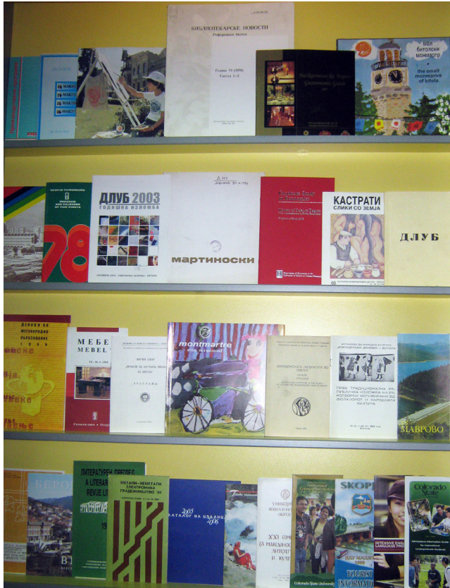
Од изложбата на дробен печат 10.07.2014