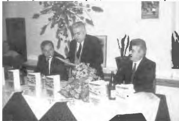
Промоција на книгата „Македонскиот печат во иселеништвото

Еднаш реков дека иселеништвото е трагедија од Шекспир. Да се иселиш од род-