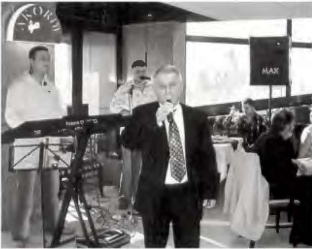
Од Патрониот Празник со вработените во ресторанот „Белведере“ во 2003 година

Војводина, "Велика плана" Србија, "Стрежево" и др. Уште побројни се моите настапи на разни свечености што по разни поводи се одржуваа во Битола и ширум