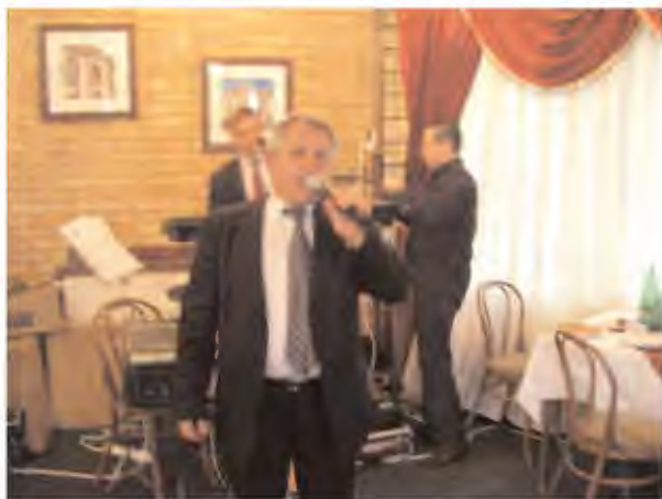
Од прославата на 60 - годишниот јубилеј на Библиотекара во ресторанот „Стрежево“ во 2005 година

Републиката, како што се: многубројните ревији на аматери пејачи, концерти, квиз натпревари придружени со музички исполнувања, дочек на штафетата на младоста во Битола, избори на златен глас за аматери пејачи, фестивали, по повод 2 Август (Илинден) на иселеничките средби во с. Трново, Десет дена Крушевска република, и др. на кои имам освоено прку 50 награди и признанија како први втори и трети награди на разни ревији на македонски народни песни. Секогаш ќе се сеќавам на ревијата на народни песни во 1967 година што ја организираше тогаш КПЗ на Битола на 03 Ноември во очи на ослободувањето на Битола во кино салата на Партизан каде што настапив со песната "Битола мој роден крај" и ја освоив втората