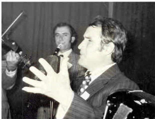
Од настапот во с.Кривогаштани, 1971 година

Неможам да заборавам дека првиот мој официјален настап го имав како ученик во трето одделение, во ОУ "Никола Карев" во с. Буково, на Општинската смотра во с. Бистрица, во 1959 година, на која се претставив со народната песна "Дај ми мамо динар до два". Со првиот мој настап е поврзан и еден