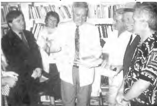
Подарок на книги за библиотеката „Григор Прличев“ од Сиднеј

односи со верските заедници. Ја искористив позицијата да помогнам во собирање на книги од издавачките куќи во Македонија. Собравме околу 19000 книги. Тоа беше време на еуфоричен национализам. Имав и свое обраќање на отворањето на Библиотеката која го носи името "Св. Климент Охридски" во Мелбурн, прва од ваков вид, со цел афирмација на културните дострели на Македонците во Австралија. Библиотеката беше отворена во рамки на активностите на Организацијата за социјални и етнички прашања "Александар - Гоце" од Мелбурн. Беше многу убаво што уште на неколку места правев помали библиотеки. Во Лајлор, предградие на Мелбурн има уште две библиотеки во кои јас носам мои книги. Нашите луѓе даваат поклони. Библиотекарството таму е на повисоко ниво.