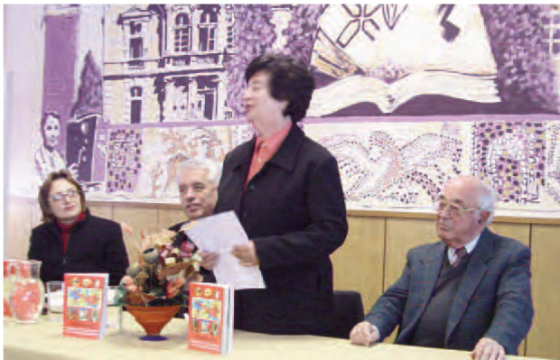
Од промоцијата на „Придонесот на Македонија во светската цивилизација