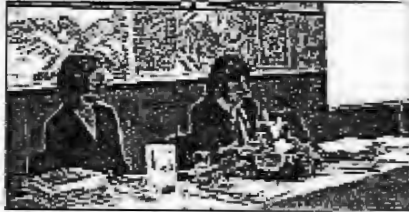
Во рамките на македонската историја, Библиотеката е институција која е неопходна за развитокот на македонската историја.

Историското значење на овие институции во македонската историја е неопходно да се признае. Библиотеката е институција која е неопходна за развитокот на македонската историја.