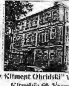
"Aziz Kliment Ohridski" Библиотека бр. 60, Битола