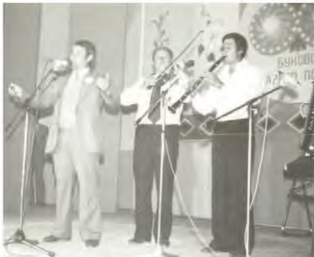
Од настапот во с. Буково, 1981 година

непосредна близина на Битола досега дало