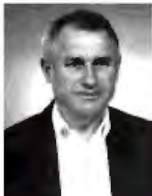
Приредил Драги Кабровски