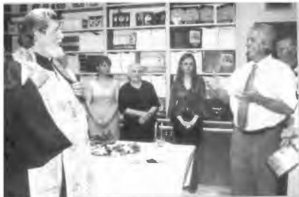
Од осветувањето на просторите на „Македонска Искра“

графијата "Катин" од Борче Наумовски. Во моментот работам на една книга "Македонија и соседите", потоа работам на