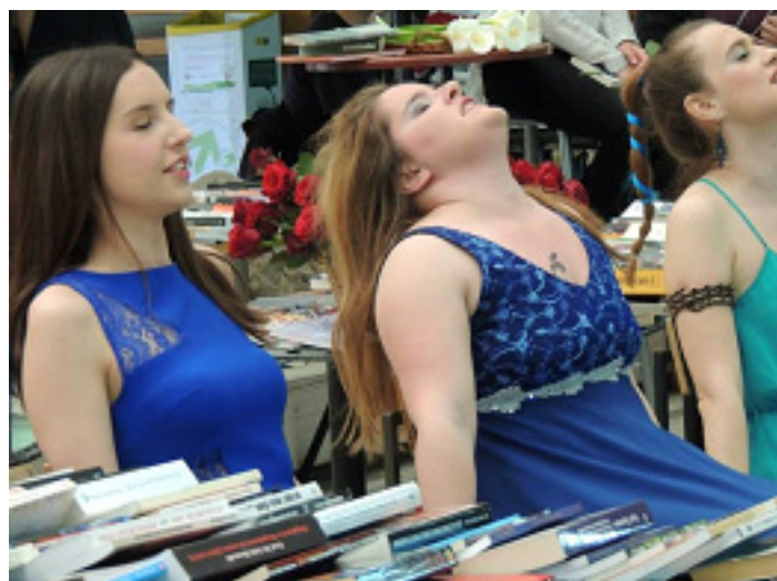
Студентки рецитираат стихови од Шекспир