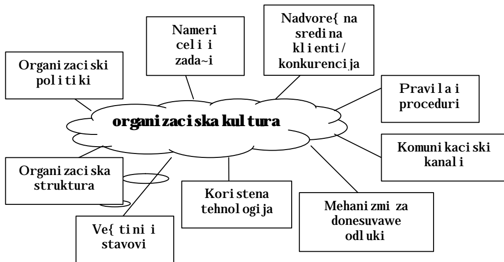
Pri kaz br. 2.

Opi sot na f unkcionalnata kultura na organizacijata vkl u-uva: nagl asuvawe na potrebata za permanentno obrazovani e i prof esionalno usovr{ uvawe na personal ot, vi soki o~ekuvawa od si te vraboteni , vodewe gri ` a za vnatre{ ni te i nadvore{ ni te resursi , razvoj i po~ituvawe na tradi cijata.